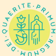
Pobres Servos da Divina Providência