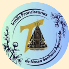
Irmãs Franciscanas de Nossa Senhora Aparecida